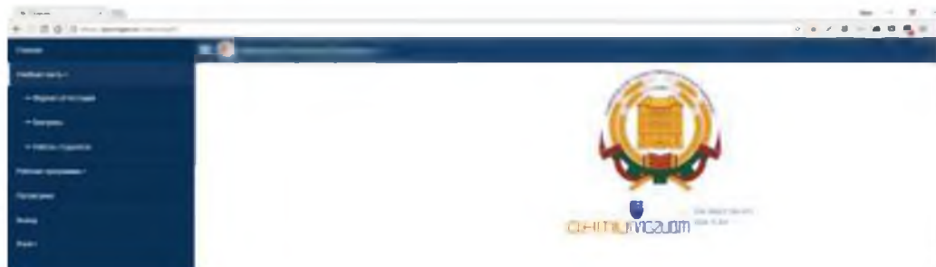
Рис. 2. Главная страница.

После успешной авторизации отобразится главная страница системы (рис. 2).