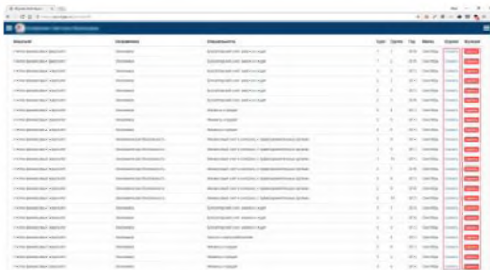
Рис. 4. Способы внесения изменений в базу документов

Также система позволяет вносить изменения в список журналов, для этого можно скачать файл либо удалить его и загрузить новый. Для скачивания либо удаления журнала требуется нажать соответствующую кнопку напротив выбранного журнала (рис. 4).