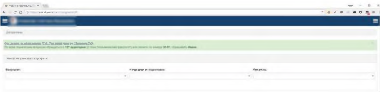
Рис. 11. Рабочие программы.

Совершив вход в личный кабинет следует раскрыть пункт меню «Рабочие программы» и выбрать «Студентам». Автоматически открывается вкладка «Дисциплины»