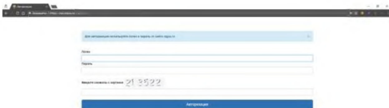
Рис. 1. Страница авторизации ЭИОС СтГАУ

Для доступа в электронную информационно-образовательную среду (ЭИОС) СтГАУ необходимо перейти по адресу https://pps.stgau.ru/ , используя доступные браузеры (Google Chrome, Mozilla Firefox, Opera, Safari, Microsoft Edge или Internet Explorer 9 и выше). Откроется страница авторизации в системе, если вы не авторизованы (рис. 1).